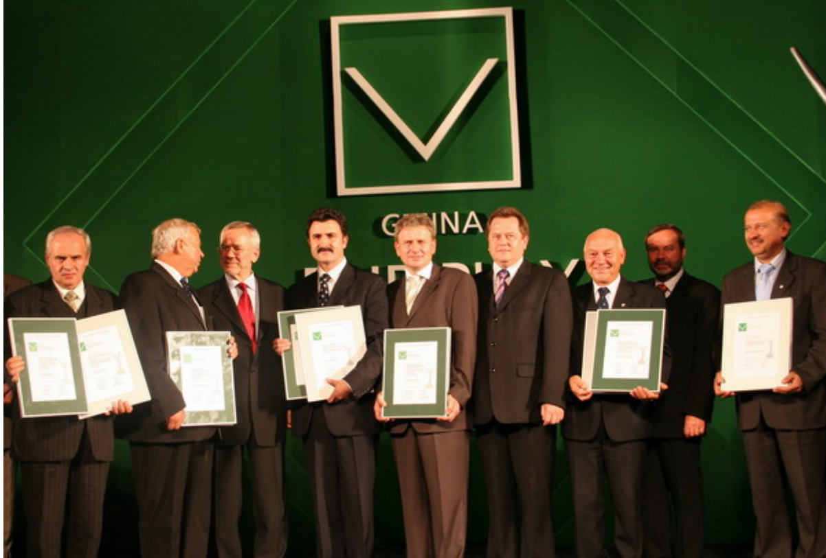
Laureaci konkursu "Gmina Fair Play 2006" w kategorii "Gmina wiejska".